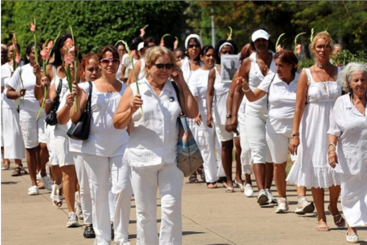
Las Damas de Blanco marchan en La Habana en marzo de 2011.